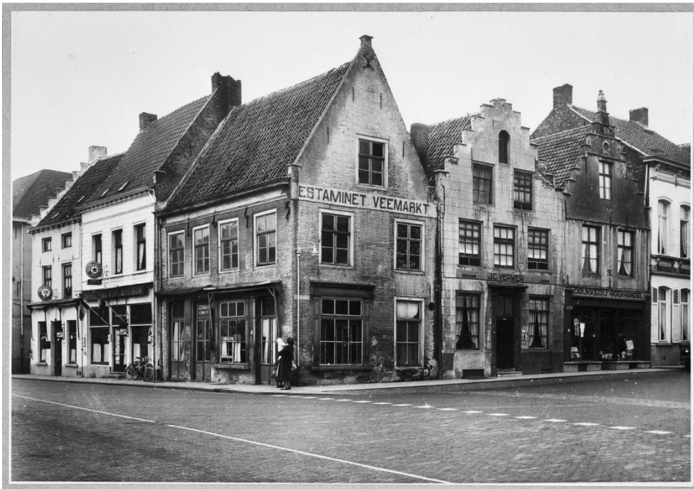
Afbeelding 7 (Rijksdienst voor het cultureel erfgoed;)