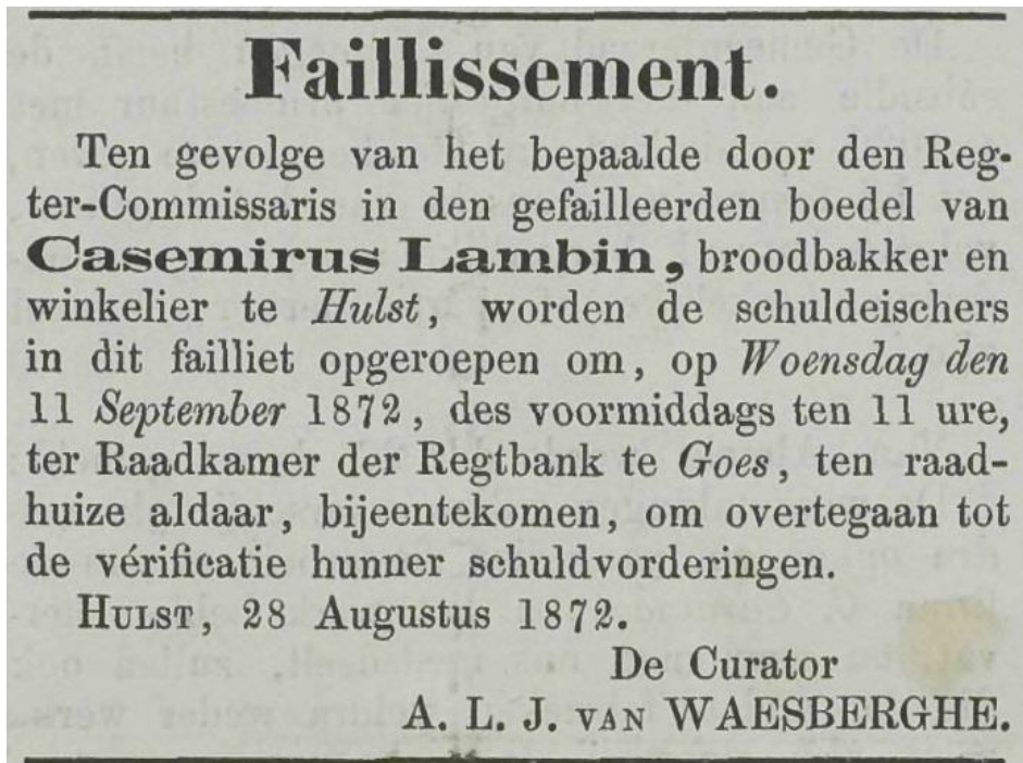
Afbeelding 5 Goese Courant van 31 augustus 1872